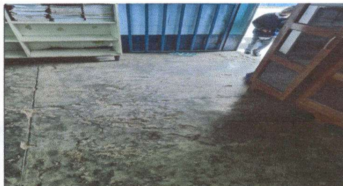
Foto 3: Piso de aula en mal estado necesario mejorarlo de 5 aulas