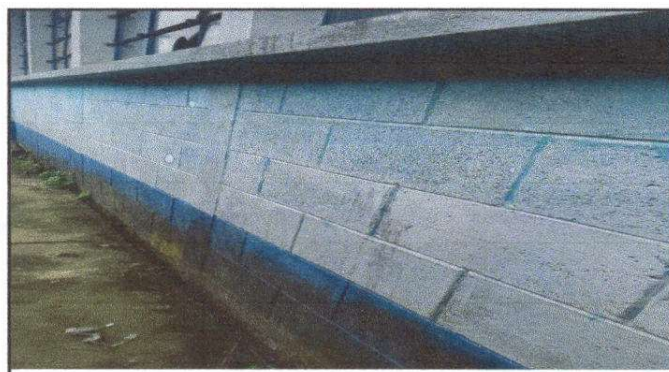
Foto 4: Pintura en muros exteriores e interiores descolorido necesario pintarlas