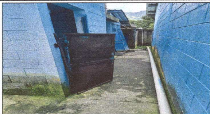
Foto 1: Mantenimiento a estructura (lijado, cambio de tubo, cepillado sujeción, aplicación de pintura puertas de baños)