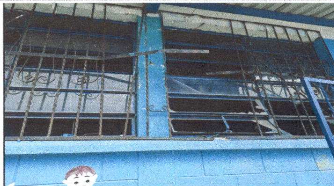
Foto 2: Vidrios quebrados necesarios cambiarlos. Balcones en mal estado necesario cambiarlos por balcones de metal